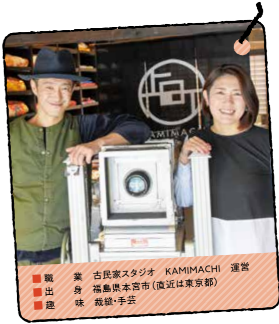
古民家スタジオ KAMIMACHI 運営 職 古民家スタジオ KAMIMACHI 運営 身 福島県本宮市(直近は東京都) 出 裁縫・手芸 趣