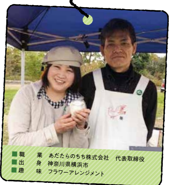
あだたらのち株式会社 代表取締役 職 あだたらのち株式会社 代表取締役 身 神奈川県横浜市 出 フラワーアレンジメント 趣