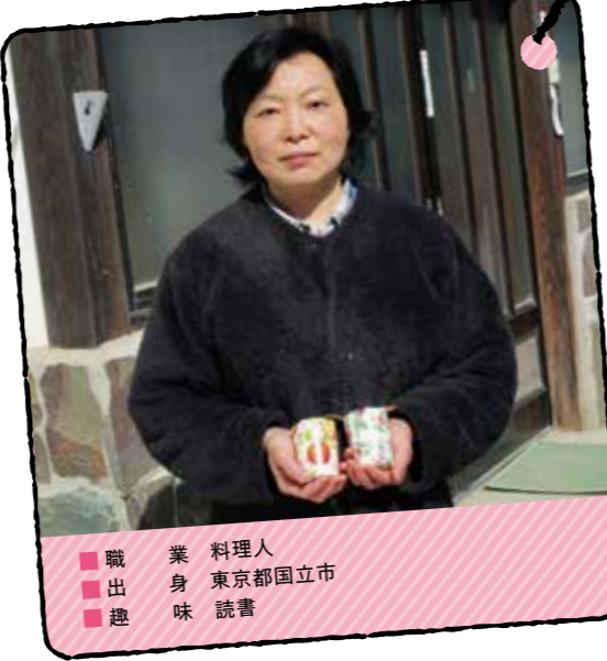
料理人 職 料理人 身 東京都国立市 出 読書 趣