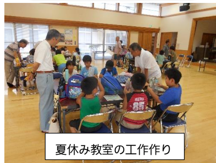
夏休み教室の工作作り