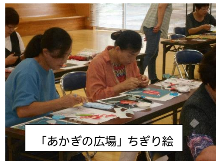
「あかぎの広場」ちぎり絵