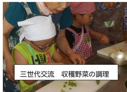
三世代交流 収穫野菜の調理