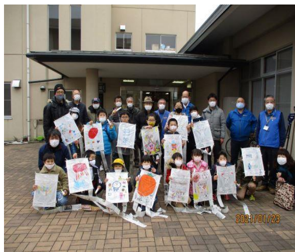
あかぎジュニアスクール「凧あげ教室」

さて、復旧工事の進捗をみながら昨年6月より貸館を再開できるようになりましたが、今度は新型コロナウイルス。そのため予定した行事等を一部中止したり、内容を簡略化したりしながら運営してまいりました。たとえば文化祭は、神輿の展示、絵画等の作品展示、少年少女の主張発表、クラブ活動の動画発表のみに内容を絞り、実施しました。また、運動会の代替として実施した月1度の「うごいてガッテン」は、誰でもできるストレッチ体操の紹介など、このような時期ならではの催しだったと思います。次年度においても新しいアイデアを出しながら運営していきたいと思っておりますので、どうぞよろしく願いいたします。