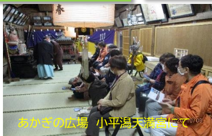
あかぎの広場 小平湯天満宮