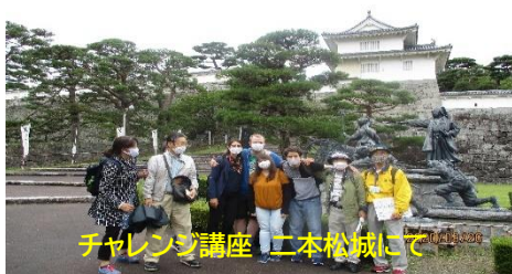
チャレンジ講座 二本松城にて