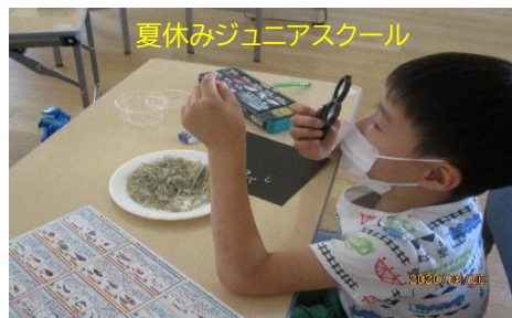
夏休みジュニアスクール