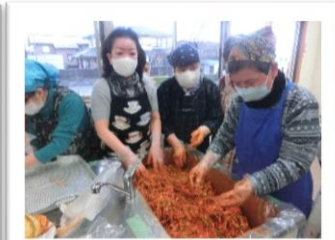
キムチづくりの体験