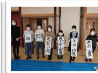
書初め完成 ハイチーズ