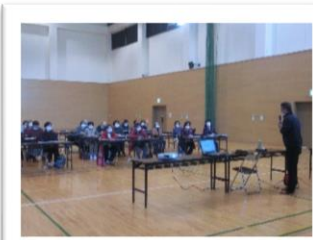
ブランド野菜のお話し