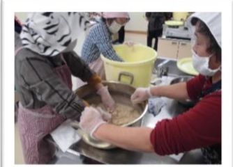
味噌の出来上がりが楽しみ