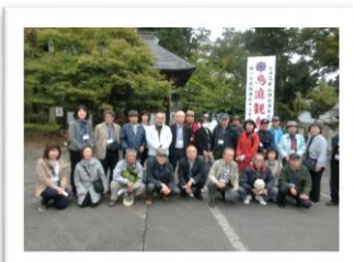
会津三観音のお参りをしました あたたかい民話で心もほかほか