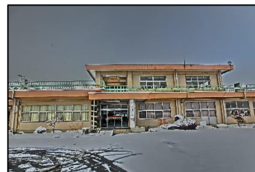
長年ご利用いただいた分室