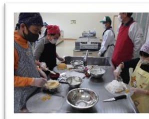
楽しいケーキづくり

大槻公民館主催の講座（「おおつきスマイル学級」「槻ノ木レディース」「男組」）では、毎年多くの皆様に参加いただいています。児童を対象にした「槻ノ木わんぱくひろば」は、地区の青少協と共催し、指導員の皆様にもご協力いただいて運営しています。次年度も引き続き開催に向けて計画を立てているところです。新たな「出会い、学び、つながり」を目指して・・・来年度もお待ちしています。 【事務局一同】