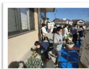
思い思いに寄せ植え体験