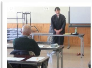
あたたかい民話で心もほかほか