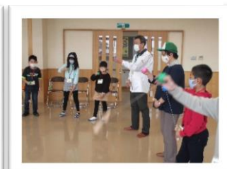
今年もけん玉に挑戦