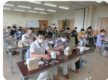
シールを丁寧に貼っていきます