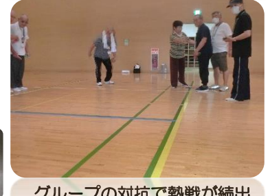
グループの対抗で熱戦が続出