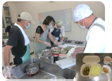
講師の先生とみんなで調理