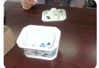
これが完成予定品です。