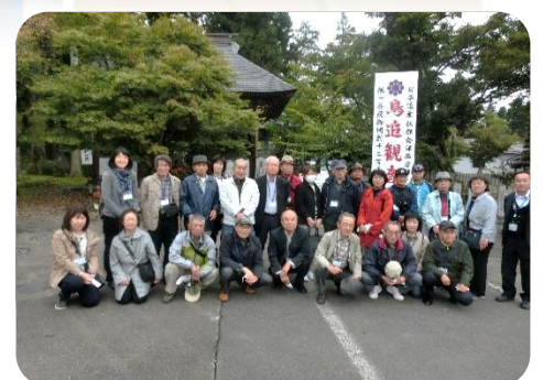
西会津町鳥追観音の前で