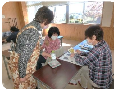
枠の線に集中し慎重に切ります