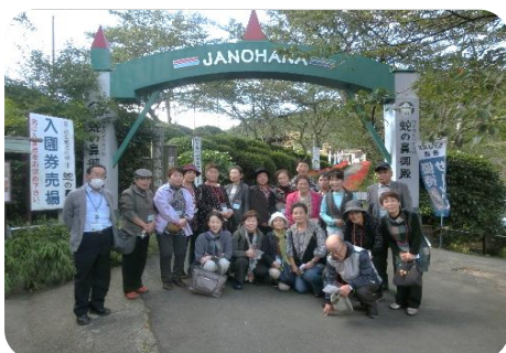
花と歴史の郷 蛇の鼻で