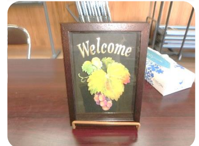
仕上がりが楽しみ完成予定