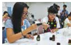
曾田香料株式会社

産総研の福島再生可能エネルギー研究所では、各自専用のタブレットを使用して、太陽光発電、地熱発電など再生可能エネルギーについて、学びました。