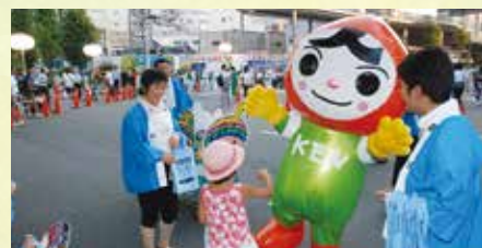
うねまつりでの人権啓発キャンペーン