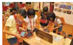
産業技術総合研究所(産総研)

世界トップレベルの次世代工学技術研究センターを見学した後、万華鏡作りを体験し、お土産として頂きました。お昼は女子大学生と一緒に食事をとりながら楽しいお話を伺いました。