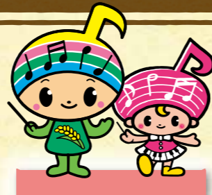
郡山市イメージキャラクターがくとくん おんぶちゃん