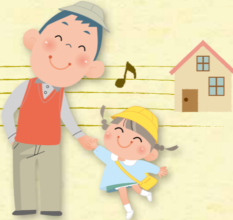
PEP Kids Koriyama ペップキッチン