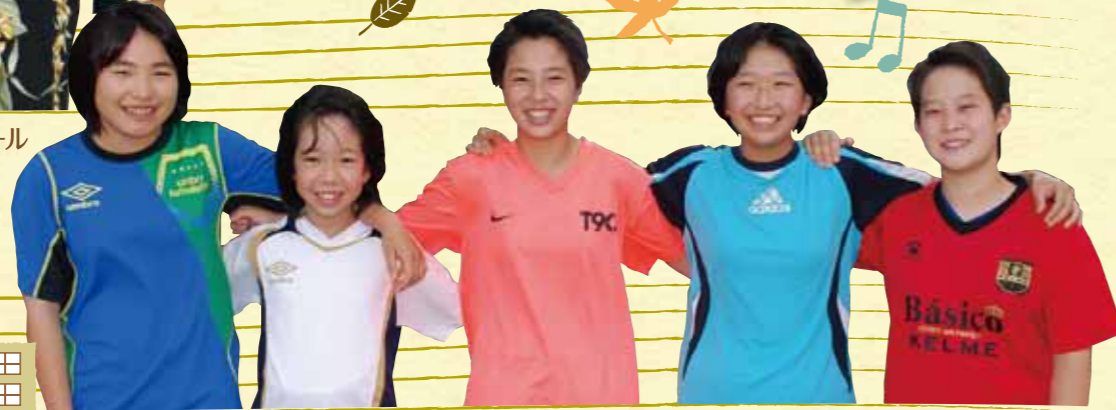
花かつみFCレディース