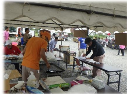
福祉施設の敬老会 に参加