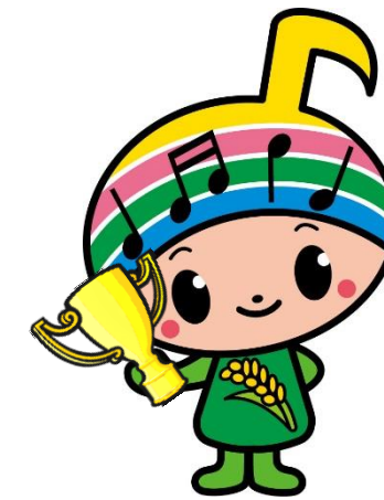
郡山市イメージキャラクター