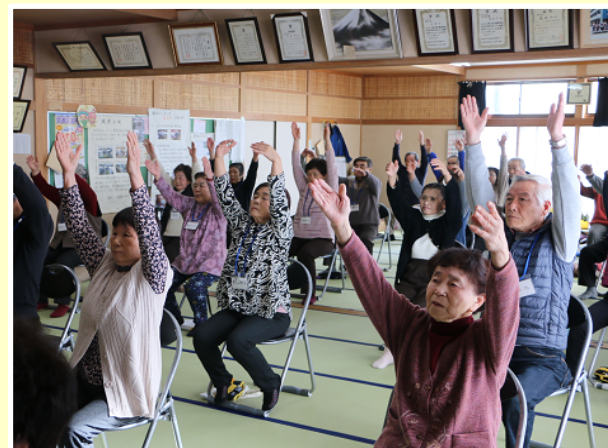
原田町内会いきいき百歳体操(原田集会所)