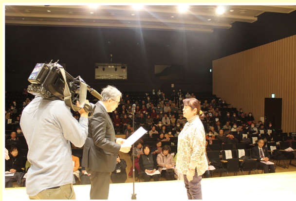
通いの場普及推進大会の様子