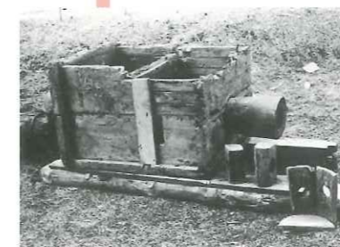
安積疏水時代の「分水箱」

新しい中央公民館は、安積開拓などの先人の偉業や、歴史ある郡山市公会堂等の周辺環境との「調和」をコンセプトとしております。 郡山市公会堂（過去）から近代的な中央公民館（未来）へ、徐々に変化するグラデーションデザインや、安積疏水時代の「分水箱」をモチーフにした施設形状は、過去から未来への郡山らしい「調和」を形としたものです。