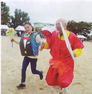
今年度も運動会やスポレク大会では、様々な年代の地域住民の参加があり、とても賑わいました

また、高齢化が進む中、新しいスポーツ等の検討もしていきたい、何卒よろしくご願ひします。