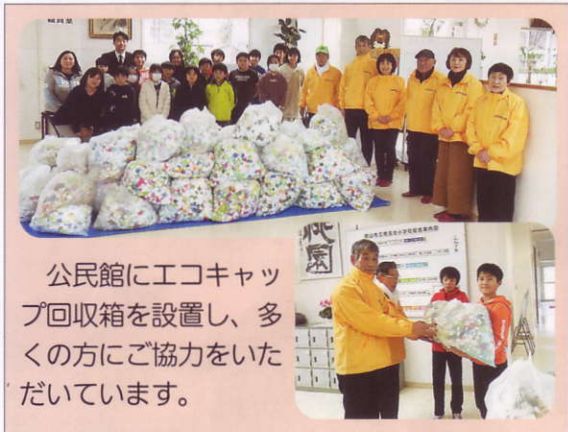
公民館にエコキャップ回収箱を設置し、多くの方にご協力をいただいています。