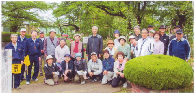
月一回開催される歩け歩け運動