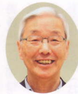
明るいまち推進委員会 委員長