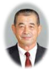
郡山市農業委員会会長