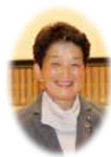
郡山市農業法人連絡会会長