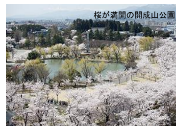
桜が満開の開成山公園

全国から集った入植者や技術者、政府、そして安積の地に生きた人々が、ともに切り拓いた安積開拓。かつて、福島県と開成社が開拓を進めていた折、灌漑用の沼の堤に、約3,900本の桜を植えた。現在でも、開拓の歴史を見守ってきたソメイヨシノの老木は、春になると開成山公園の土手一帯を覆い尽くす。