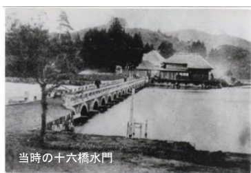
当時の十六橋水門

で初めて疏水の設計に導入したことである。当時最先端の機器が用いられ、実測データに基づき科学的に検討するという従来の経験主義を脱却した草分け的な設計であった。この検証により、安積原野へ水を流しても、西側へ流れる水量は減らないことが実証され、水利という長年の大きな課題を解決に導いた。また、猪苗代湖の氾濫に苦しんでいた湖岸の住人達は、十六橋水門が治水の役割も持つことを知り、遠く離れた地からボランティアとしてこの工事に参加した。その人数は500人以上にのぼり、この大仕事を1年程で完成させた。水路工事の最大の難関は、奥羽山脈に全長585mのトンネルを掘り、安積原野まで水を一気に流すことであった。硬い岩石を砕くダイナマイト、地下水を外に汲み出す蒸気ポンプ、補強のためのセメントなど、外国の最新技術が使われていった。また、鹿児島、大分、東京、横浜、岩手、新潟など全国から多くの技術者たちが集ってきた。開拓者たちの安積原野と猪苗代湖を繋ぐ挑戦は、疏水通水へと結実し、後の那須疏水と琵琶湖疏水の建設に大きな影響を与えたのである。