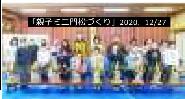
「親子ミニ門松づくり」2020. 12/27