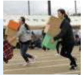
【「宅配リレー」昨年の体育祭】→

さて、5月16日から公民館も再開して以来、7月に入りにぎやかさが戻ってきました。利用される皆様には多少ご不便をおかけすることもあります。感染拡大防止にご協力をお願いいたします。