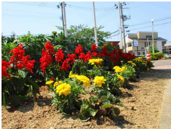
花壇の花がきれいです

発行 郡山市立富田公民館 館長 佐久間 郁文 Tel/Fax 024-951-0260