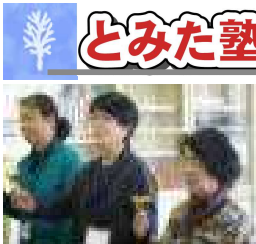
【ハンドベル演奏（昨年）】

※参加をお待ちしております。詳しくは回覧チラシにて確認、もしくはお問い合わせください。