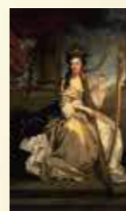
サー・ジョージア・レイノルズ「エグリントン伯爵夫人、ジェーン」

日本と相互に影響を与えたイギリス近代美術を約500点収蔵。そのコレクションは日本では珍しく、内外から高く評価されています。