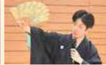
野村 萬齋さん (狂言師)

駐車場から美術館入口までの道沿いにある庭園は緑豊かで、四季折々の風景が楽しめます。展覧会の前にゆっくり散歩がおすすめです。ふと気が向いた時に訪れ、散歩してみるのもいいかもしれませんね。また、美術館通りからは、市内を一望できますので、そちらもあわせてお楽しみください。