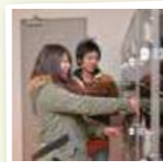
コインロッカーは無料で利用できます。

現在は舟越保武彫刻展(関連17ページ)を開催しているほか、過去には「藤城清治の世界展」や、郡山市ゆかりの作家「佐藤静司彫刻展」など、特色ある展覧会を開いていますよ。