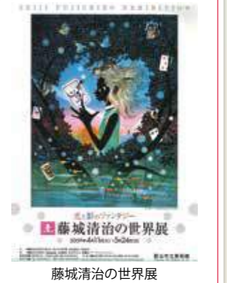
藤城清治の世界展