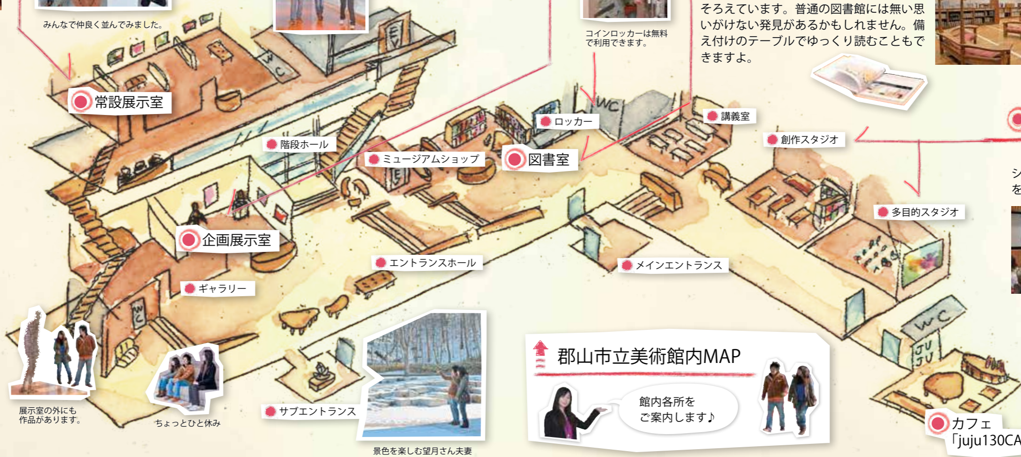
展示室の外にも作品があります。