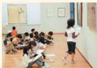
子どもたちみんなで鑑賞中