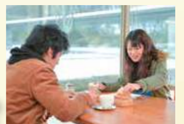
おいしいコーヒーやデザートに、2人も大満足