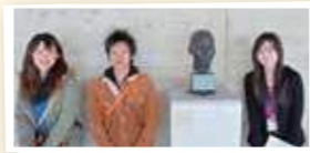
みんなで仲良く並んでみました。