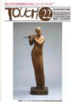
郡山市立美術館友の会ニュース「タッチ」