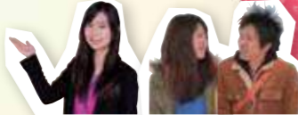
志村 ふくみさん (染織家・人間国宝)

ワークショップでは、鉄道ジオラマや手作りカメラを制作するなど、毎回大人気です。 さらに、多彩なジャンルで活躍されている方が講師を務める美術文化講座「アート・テーク」では、これまでに狂言師の野村萬齋さんや、染織家で人間国宝の志村ふくみさんなど、の著名な方をお招きしています。