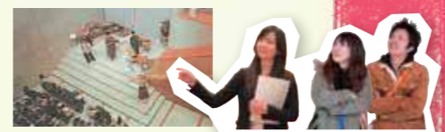
ミュージアム・コンサート

はい。例えば、階段ホールで開催しているミュージアム・コンサートは、楽器の生演奏が館内に響き渡り、迫力満点。 また、各分野の専門家に教わる