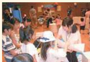
夏休みのワークショップ