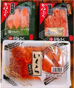
写真は海の宝石セットのイメージ写真です