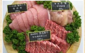
写真は和牛焼肉セット(5,000円)のイメージ写真です

◆海の宝石セット 4,000円(税込) ロシア産いくら醤油250g / アメリカ・ロシア産たらこ140g / アメリカ・ロシア産明太子140g