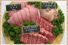
写真は和牛焼肉セット(5,000円)のイメージ写真です