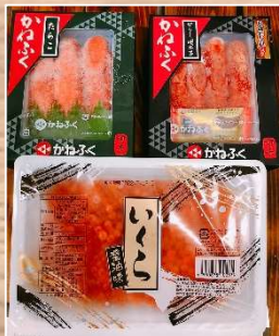
写真は海の宝石セットのイメージ写真です