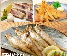
写真は干物セット