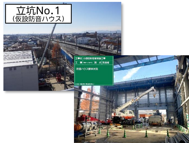
仮設防音ハウス解体・撤去状況