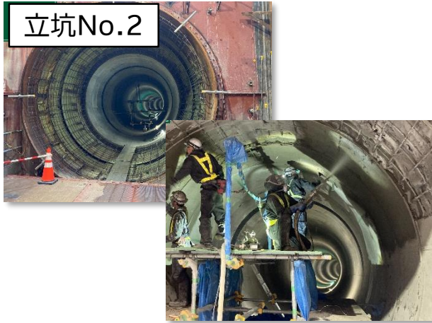
シールド掘進機残置部のモルタル吹付状況

12月は、引き続き、仮設防音ハウス及びシールド工に係る各種設備の解体・撤去等を行います。