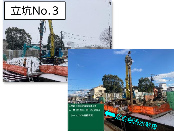
仮設土留(鋼矢板)設置状況