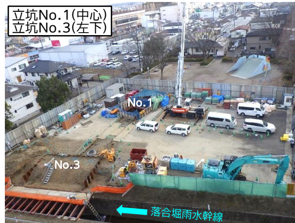
仮設土留設置等状況(池田公園内)