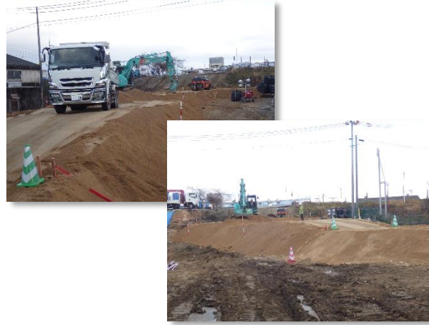
仮設道路設置状況