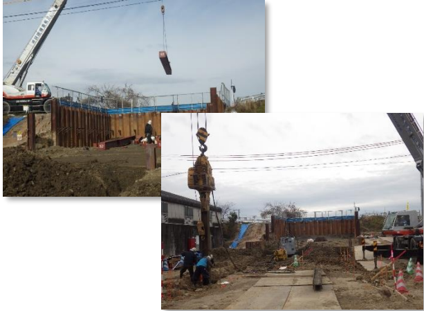
仮設土留撤去状況

12月は、ボックスカルバート布設に係る仮設土留撤去及び仮設道路設置を行いました。 1月は、引き続き、仮設道路設置を行い、仮棧橋設置に着手します。