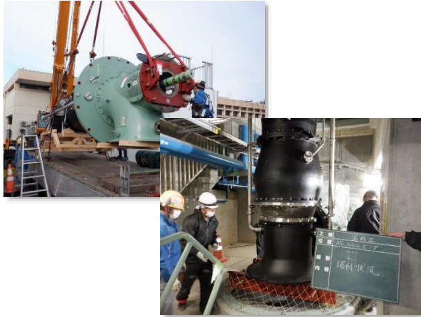
雨水ポンプ本体搬入・据付状況

1月は、No.3雨水ポンプ本体及び原動機、減速機、消音機の搬入・据付を行いました。 2月は、No.3雨水ポンプに係る各種配管設置等を行います。