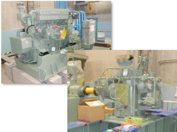
雨水ポンプ用原動機・減速機据付状況