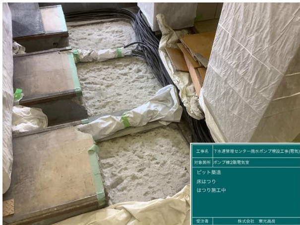
ピット工事(コンクリート床はつり)状況