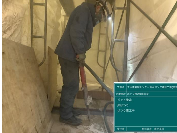
ピット工事(コンクリート床はつり)状況