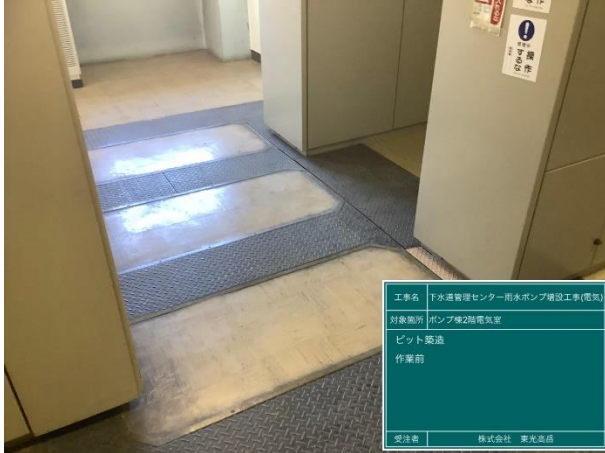
ピット工事(コンクリート床はつり)状況

12月は、下水道管理センターポンプ棟において、コントロールセンター盤、補助継電器盤及びケーブル設置等のためのピット工事(コンクリート床はつり)を行いました。 1月は、引き続き、ピット工事を行い、各種電気盤の架台設置を行います。