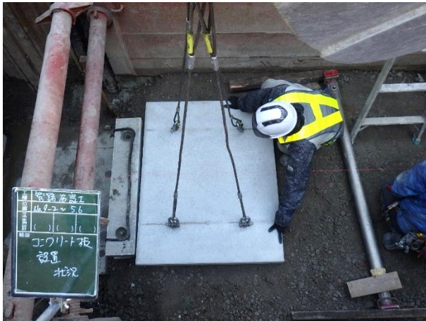
基礎(既製コンクリート板設置)工状況