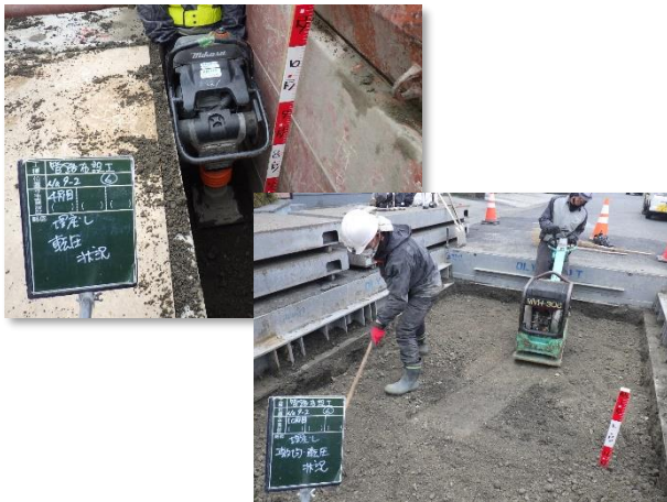
埋戻し・転圧状況