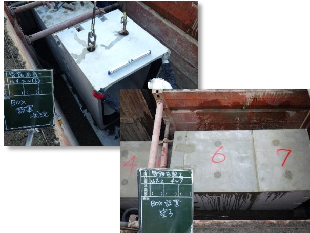
ボックスカルバート布設状況