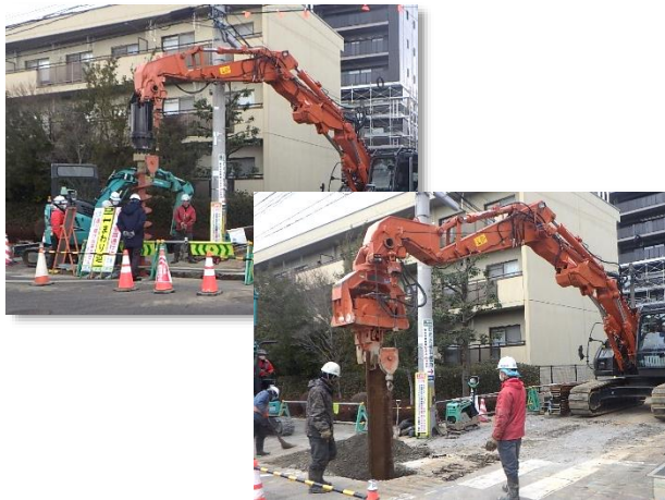
ア-オ-ガ 先行掘削・仮設土留(鋼矢板)設置状況