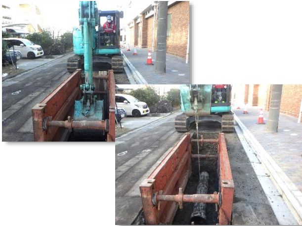
既設合流管撤去状況

1月は、東西路線の既設合流管撤去及び街渠柵接続替え等を行い、南北路線の角形マンホール設置に係る仮設土留設置に着手しました。 2月は、引き続き、既設合流管撤去及び仮設土留設置等を行います。