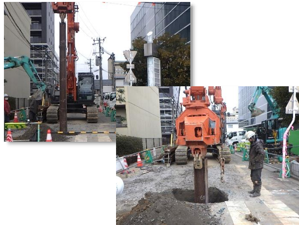
仮設土留(H形鋼)設置状況