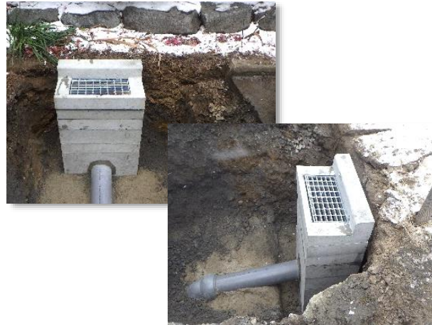
街渠柵接続替え状況