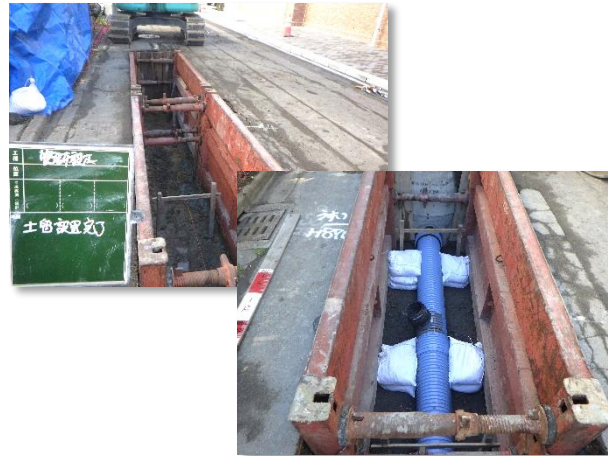
建込簡易土留・合流管布設状況