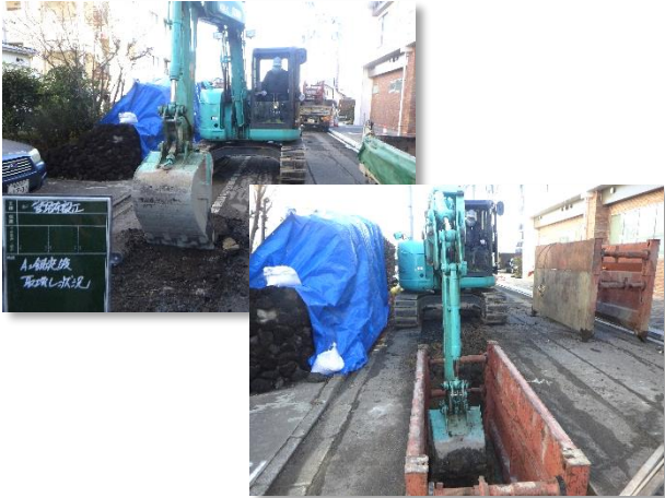
舗装取壊し・掘削状況

12月は、建込簡易土留を行いながら、東西路線の合流管(φ250mm)の布設替え(約110m)を行いました。 1月は、引き続き、合流管の布設替えを行います。