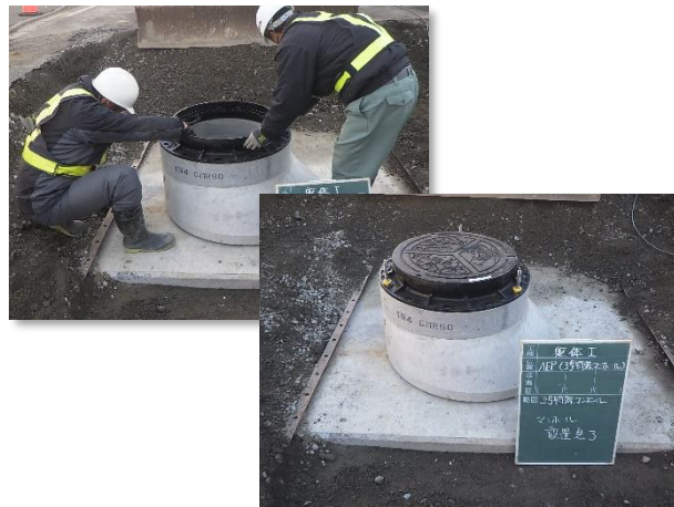
No.3特殊人孔築造完了状況