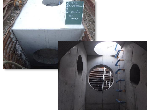
No.3特殊人孔築造状況