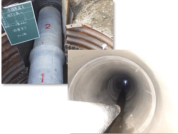
導水管(統合管)設置状況

12月は、合流管(φ250mm)接続、舗装仮復旧等を行い、第3工区の工事が完了する見込みです。