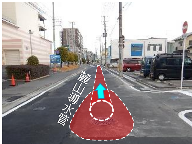
舗装仮復旧完了状況