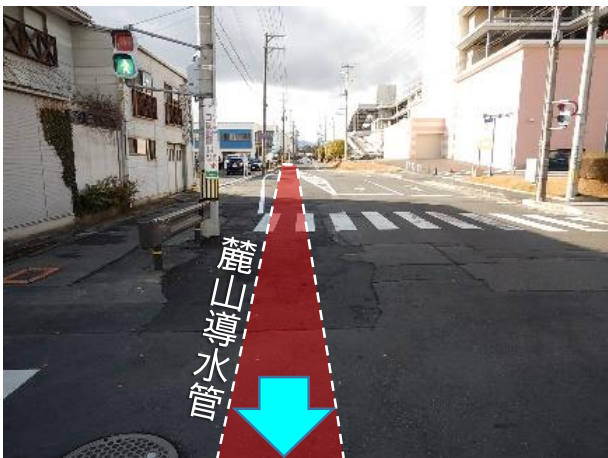
舗装仮復旧完了状況