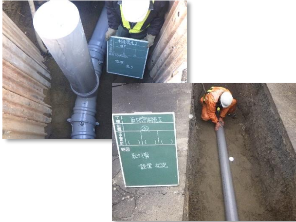
合流管(φ250mm)及び取付管設置状況

12月は、合流管(φ250mm)接続等を行い、第3工区の工事(施工延長約112m)が完了し、麓山導水管(東西線)が完成しました。本工事へのご理解とご協力ありがとうございました。引き続き、第4工区の工事を推進し、麓山導水管(南北線)の早期完成を目指します。