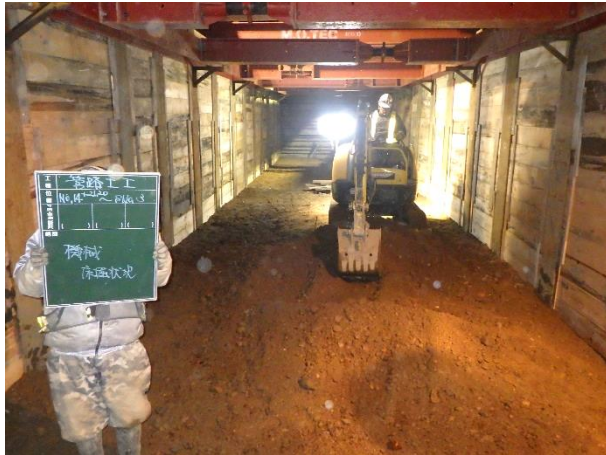
掘削・支保工状況

11月は、特殊人孔下流側の掘削・支保工を行い、基礎工及びボックスカルバート布設(L=22m)を行いました。 12月は、特殊人孔上流側のボックスカルバート布設等を行います。