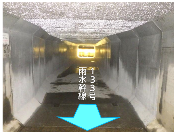
ボックスカルバート布設完了(内部)状況