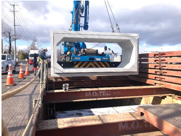
ボックスカルバート布設状況

12月は、No.3特殊人孔上流側のボックスカルバート布設(L=79m)を行いました。 1月は、ボックスカルバート脇の埋戻し及びNo.3特殊人孔築造等を行います。