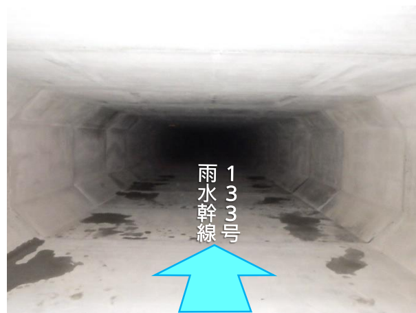
ボックスカルバート布設完了(内部)状況