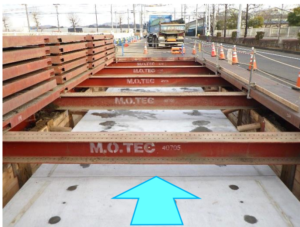
ボックスカルバート布設完了状況