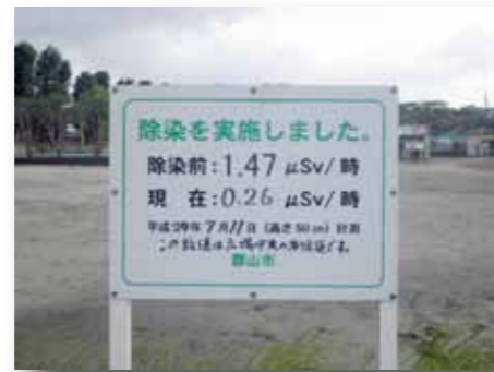
除染を実施した公園等には看板を設置