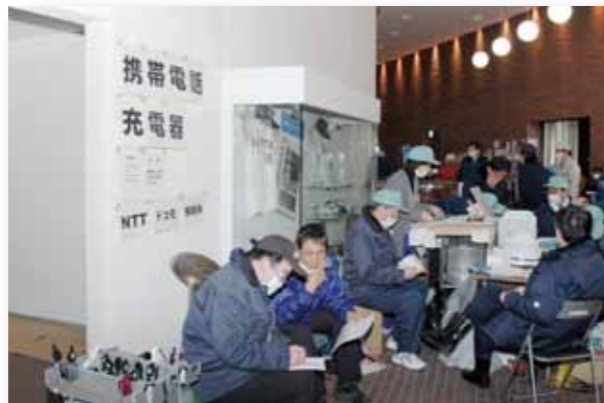
各部局は当初開成山野球場内通路に事務局を設置し対応