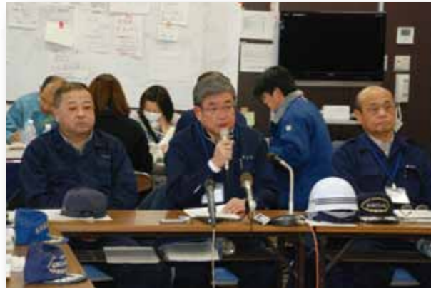
災害対策本部会議