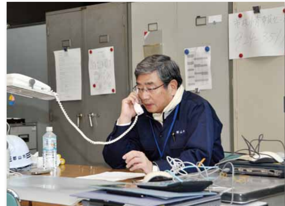
ラジオを通してメッセージ発信