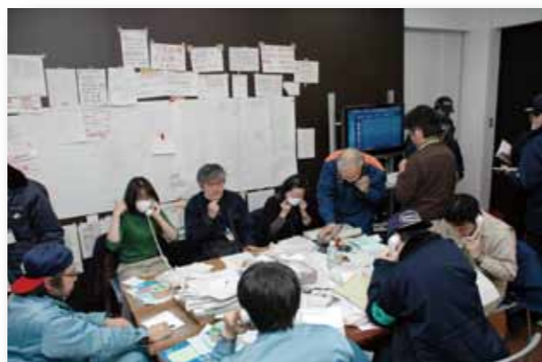
多数寄せられる問い合わせに対応

平成23年5月1日からは、災害対策本部をミュージカルがくと館（郡山市音楽・文化交流館）へ移動しました。平成24年8月6日からは、災害対策本部事務局を消防防災課（市役所分庁舎5階）へ移動し対応しています。