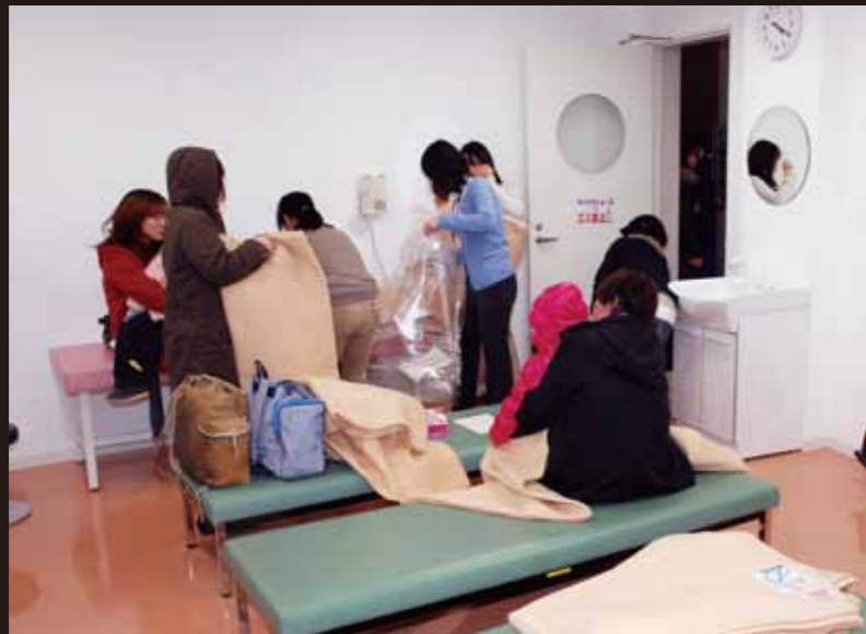
女性に配慮し、女性専用スペースを設置