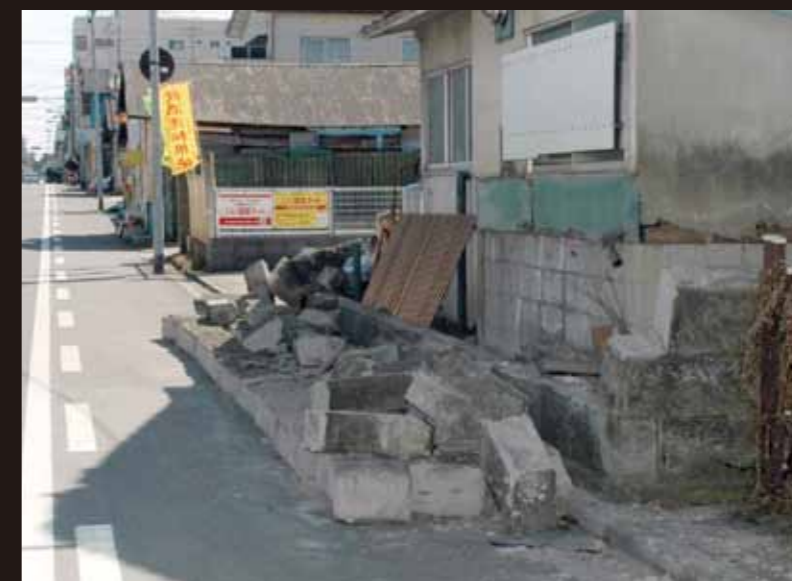
塀が倒れる被害も多数発生 倒れた塀で通行できない道路もあった