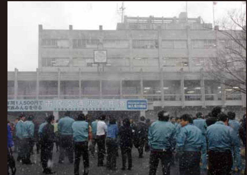
それまで晴れていたが、急に暗くなり吹雪となった