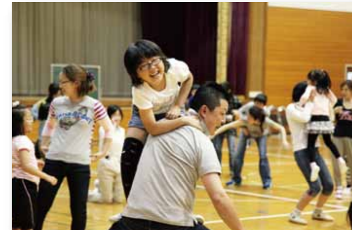
親子での室内遊び