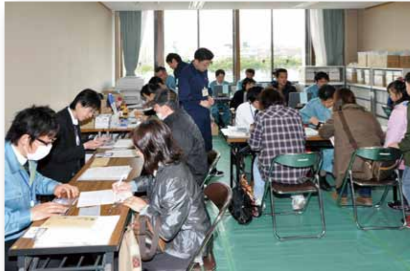
リ災証明受付窓口(ミュールがくと館)