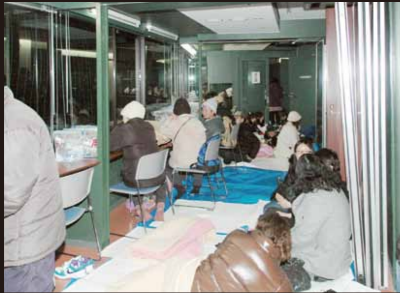
防災拠点として整備した開成山野球場も避難所に