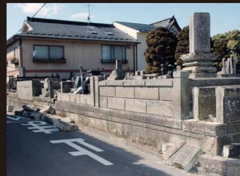
地震で倒れてしまった墓石も多く見受けられた