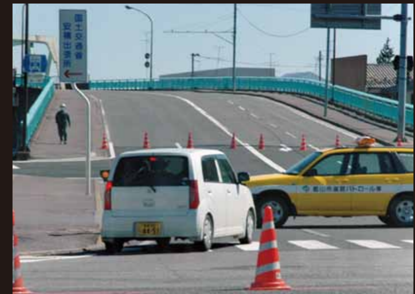
橋崩落の恐れがあり、通行止めに