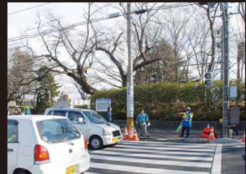
停電で信号も消え、交通が大混乱