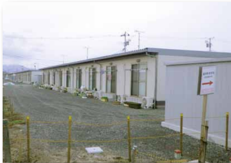
郡山市内の仮設住宅