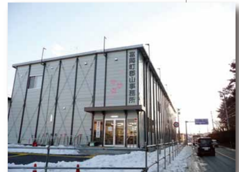
富岡町郡山事務所