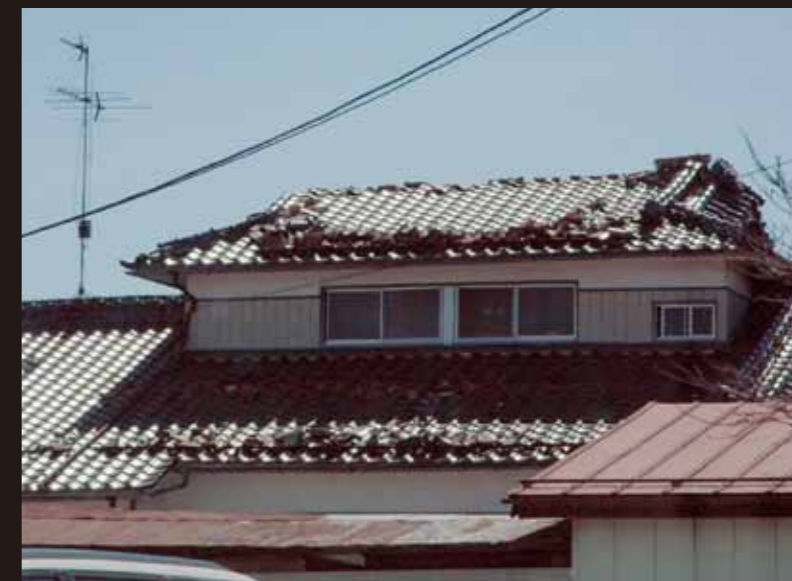
瓦屋根が被害を受ける家屋が多数発生