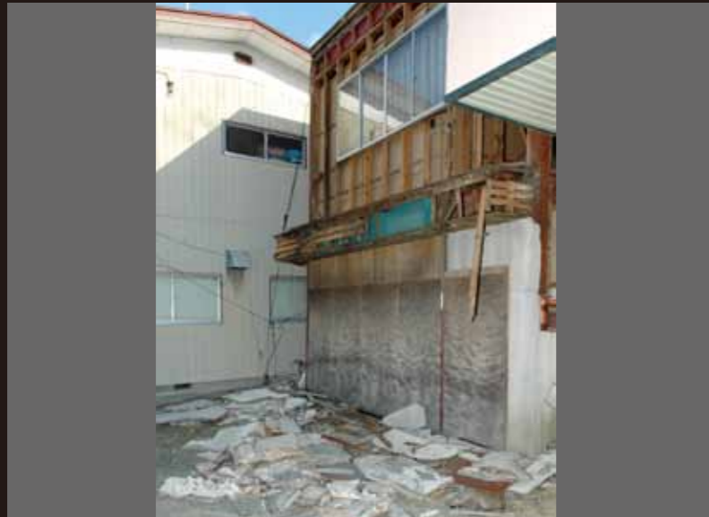
壁などが崩落する建物も多数