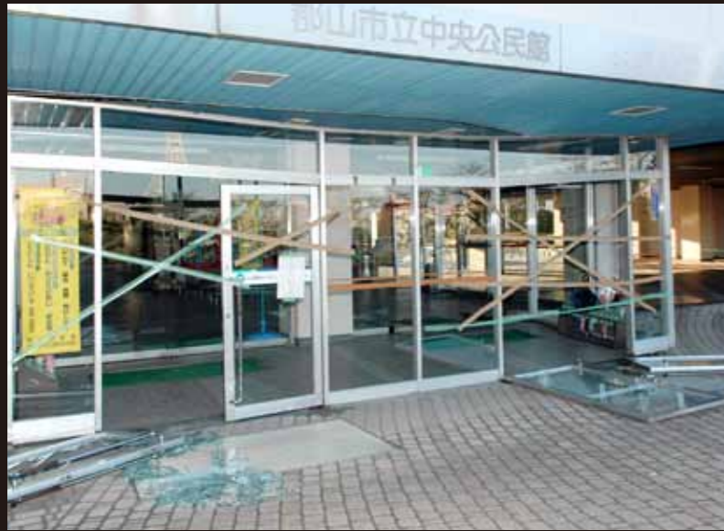
中央公民館は危険な状態となり、立ち入り禁止に