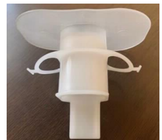
【開発したマウスピース】

併せて、現在、福島県立医科大学と連携し、従来マウスピースと比較したユーザビリティ評価を実施している。