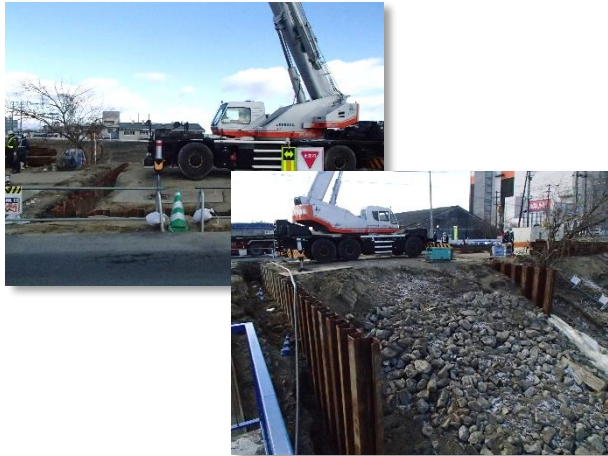
仮設土留(鋼矢板)施工状況

2月は、吐口樋門に係る仮設土留及び仮棧橋設置等を行いました。 3月は、引き続き、仮棧橋設置等を行い、吐口樋門本体・翼壁設置に係る掘削・支保工に着手します。