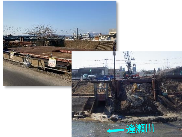
仮設土留・仮棧橋設置状況