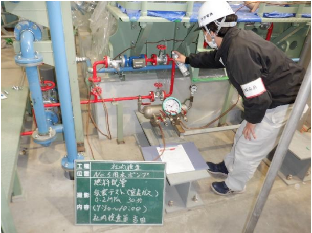
各種配管気密テスト状況