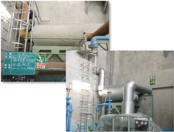
各種配管(排ガス管、No.3消音機)設置完了状況

2月は、No.3雨水ポンプに係る各種配管設置を行い、各種配管の気密テスト等を行いました。 3月は、No.3雨水ポンプの総合試運転等を行い、雨水ポンプ増設工事(機械)が完了する見込みです。