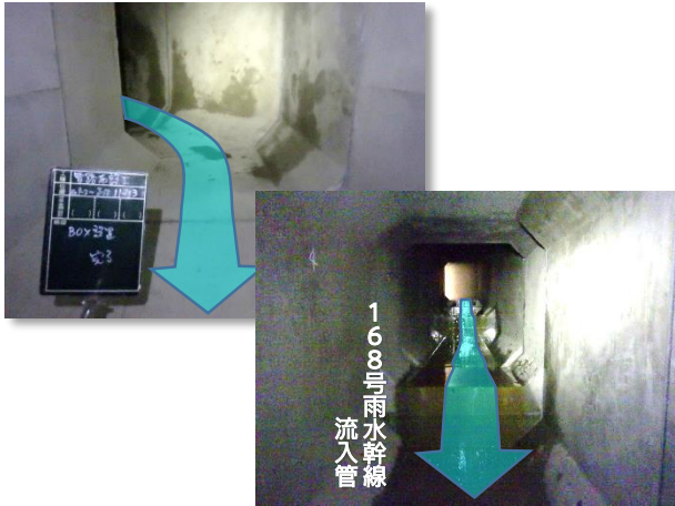
ボックスカルバート布設完了(内部)状況

2月は、ボックスカルバート布設(施工延長約14m)が完了し、既存水路接続及び舗装本復旧(第1~4工区)、現場の後片付け等、第4工区の工事が完了しました。本工事へのご理解とご協力ありがとうございました。