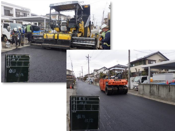
舗装本復旧(舗設・転圧)状況