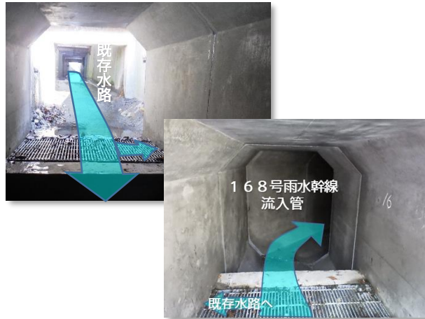
既存水路接続(内部)状況