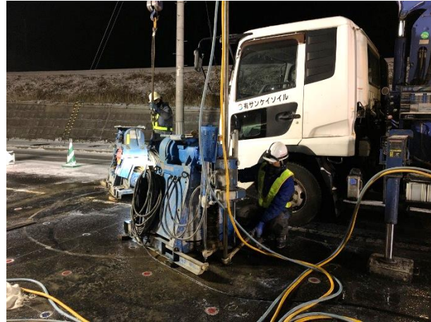
地盤改良(薬液注入)状況