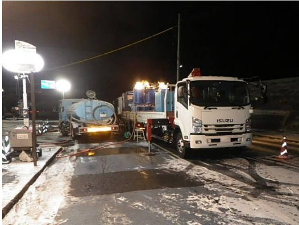
地盤改良(薬液注入)状況

2月は、下流側区間の既設5号幹線への割込み人孔築造に係る地盤改良を行いました。 3月は、引き続き、地盤改良を行い、仮設土留(ライナープレート)に着手します。