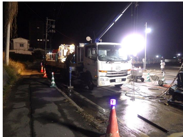
地盤改良(薬液注入)状況