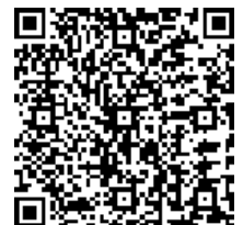
公民館HPアクセスQRコード

薫地区連絡協議会のご支援と公民館を利用されている皆さまのご協力のおかげで、花壇に花オクラ・サルビア・マリーゴールドが、きれいに咲いています！ 大葉とプチトマトも見事になっています！ お近くにお越しの際はご覧ください。