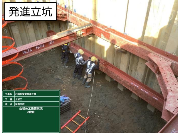
仮設土留設置状況

4月は、引き続き、到達立坑の仮設土留設置を行い、推進用ヒューム管施工に係る坑口処理等に着手します。