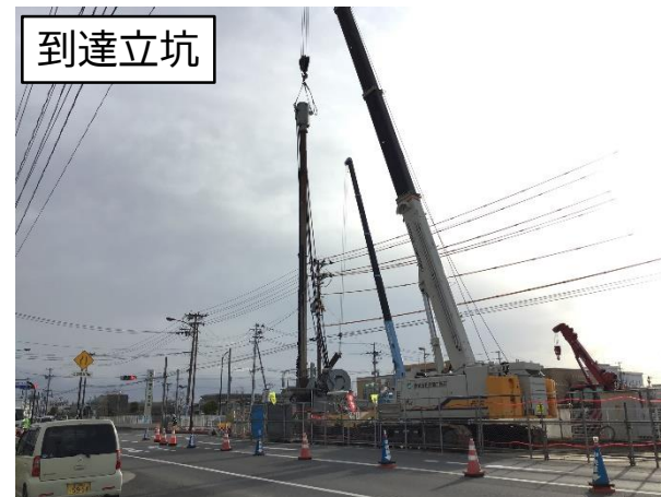
仮設土留設置(先行掘削)状況