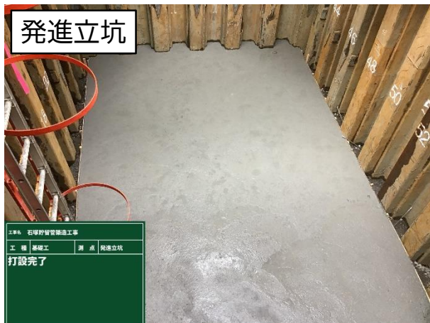
基礎コンクリート打設完了状況