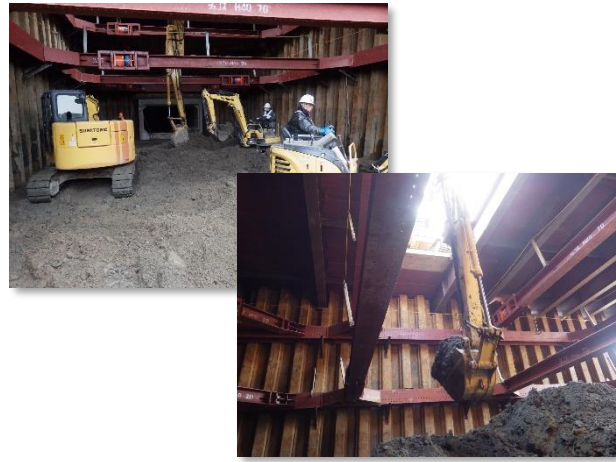
仮設土留・仮締切・掘削状況