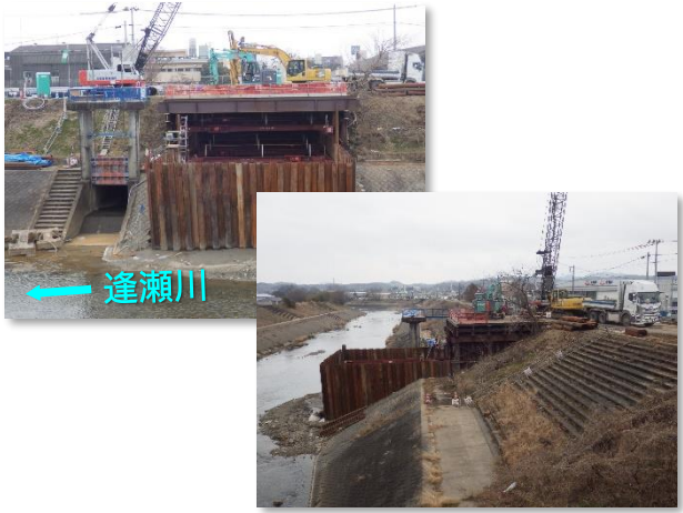
仮設土留・仮締切状況

3月は、吐口樋門・翼壁設置に係る仮設土留及び仮締切工、掘削等を行いました。 4月は、引き続き、掘削等を行い、川面翼壁工及び護床工に着手します。