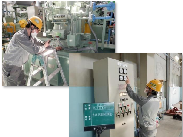
総合試運転・調整(減速機振動・現場操作盤)状況