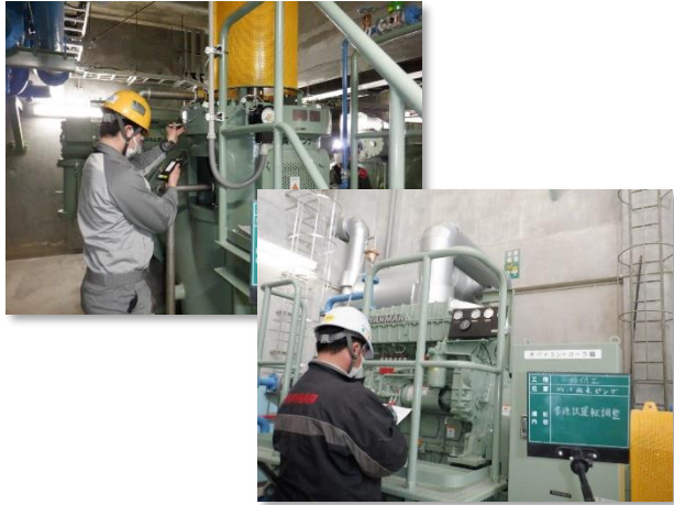
総合試運転・調整(ポンプ振動・騒音)状況

3月は、No.3雨水ポンプの総合試運転及び調整等を行い、雨水ポンプ増設工事(機械) が完了しました。