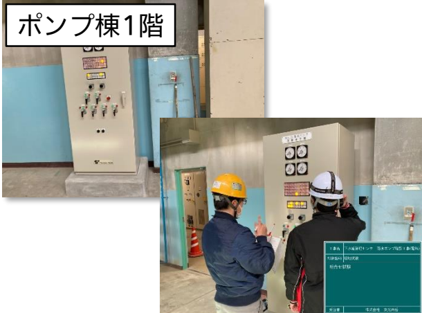
総合試運転・調整(現場操作盤)状況

3月は、No.3雨水ポンプの総合試運転及び調整、操作説明会を行い、雨水ポンプ増設工事(電気)が完了しました。