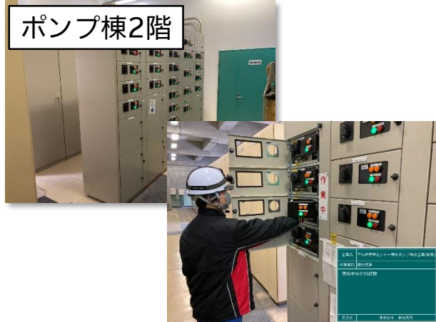
総合試運転・調整(コントロールセンター盤)状況