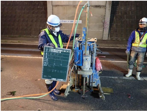
地盤改良(薬液注入)状況