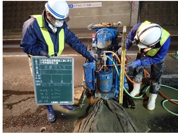
地盤改良(薬液注入)状況