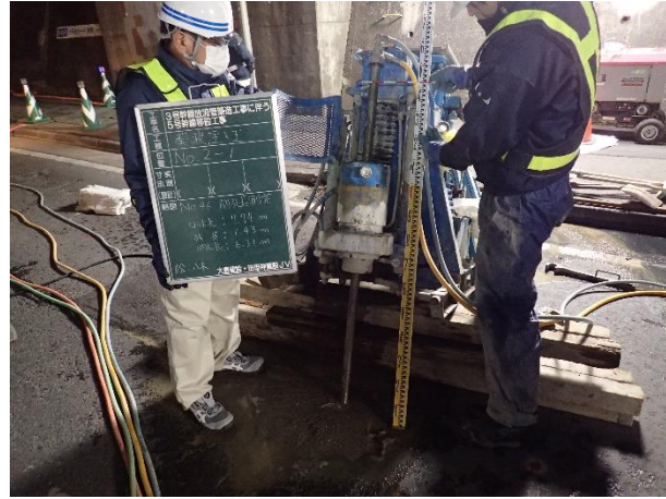
地盤改良(薬液注入)状況