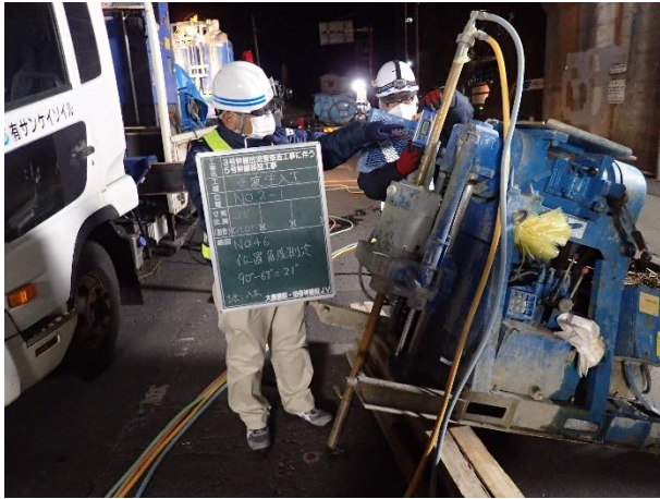
地盤改良(薬液注入)状況

3月は、下流側区間の既設5号幹線への割込み人孔築造に係る地盤改良を行いました。 4月は、引き続き、地盤改良を行い、仮設土留(ライナープレート)に着手します。