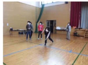
カーリンコンの体験より