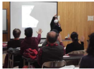
消費者出前講座より