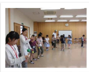
けん玉名人に習いました。