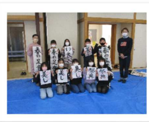
今年も良い年に(書初め)

大槻公民館主催の講座(「おおつきスマイル学級」「槻ノ木レディース」「男組」)では、毎年5月に募集していますが、多くの方に参加していただいています。講師の先生方のご協力も得ながら企画・運営しているところです。大槻小学校の児童を対象にした「槻ノ木わんぱくひろば」は、地区の青少協の指導員の皆様にもご協力いただいています。現在次年度の計画づくりをしているところです。来年度もお待ちしておりますので、ぜひ初めての方も申し込みください。【事務局一同】