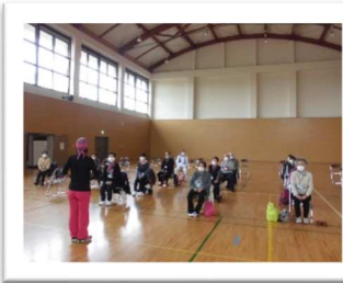
椅子での健康体操より