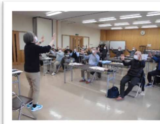
健康長寿大作戦より