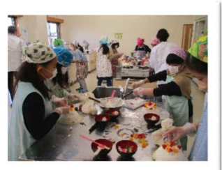
マイクリスマスケーキづくり

大槻公民館主催の講座(「おおつきスマイル学級」「槻ノ木レディース」「男組」)では、毎年5月に募集していますが、多くの方に参加していただいています。講師の先生方のご協力も得ながら企画・運営しているところです。大槻小学校の児童を対象にした「槻ノ木わんぱくひろば」は、地区の青少協の指導員の皆様にもご協力いただいています。現在次年度の計画づくりをしているところです。来年度もお待ちしておりますので、ぜひ初めての方も申し込みください。【事務局一同】