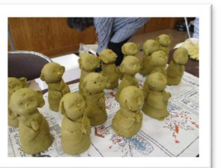
表情豊かなお地藏さん