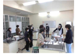
おいしい紅茶の入れ方実習