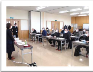
スマートフォン講座より