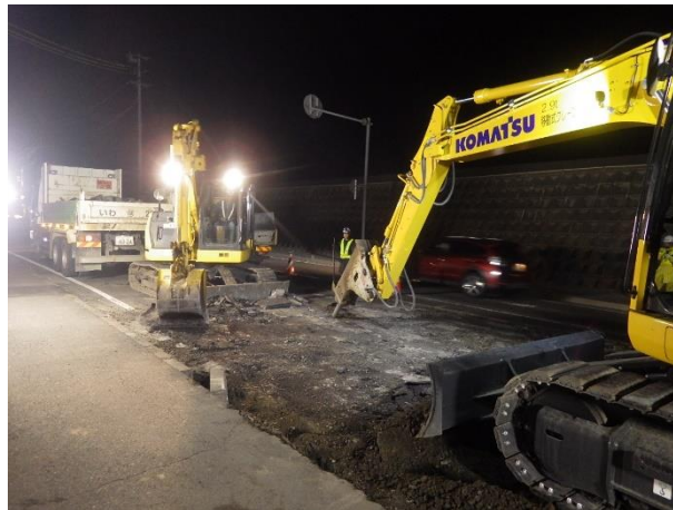
覆工板設置に伴う掘削状況