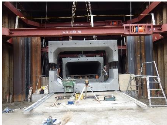
樋門本体設置状況