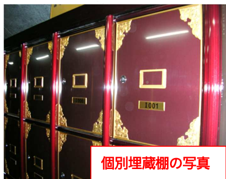
個別埋蔵棚の写真