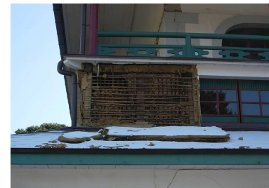
(東日本大震災時の被害)