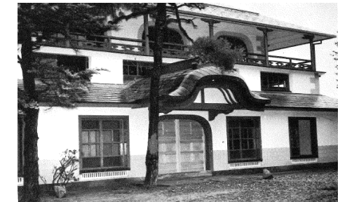
(昭和41年復元時の開成館)