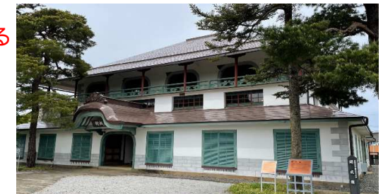
(東日本大震災復旧後の姿)