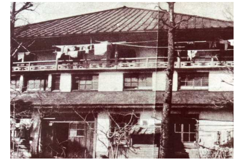
(戦后市営住宅時代)