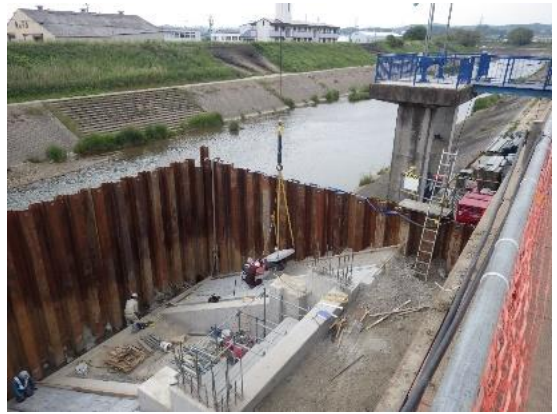
低水護岸施工状況