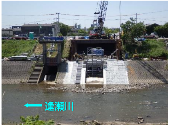
樋門本体設置全景