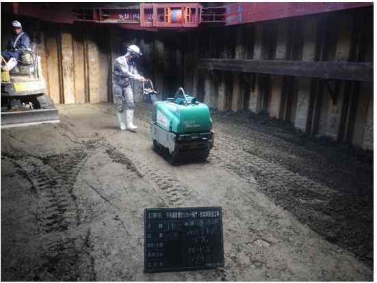
樋門本体埋戻し状況

5月は、吐口樋門本体埋戻し及び低水護岸工等を行いました。 6月は、引き続き、吐口樋門本体埋戻し及び高水護岸工等を行います。